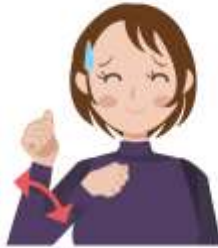
暑い 団扇でパタパタと 煽く仕草をします。