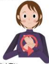
お大事に 胸に当てた左手の甲を 右手で2、3回まわしてなでる。