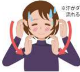
※汗がダ〜つと 流れるさま。