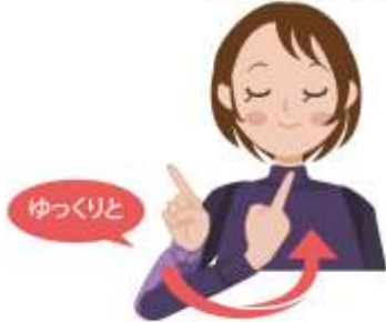
自然/自然に～ 右手の人差し指を伸ばして、手首を返しながら指先を上に向けます。