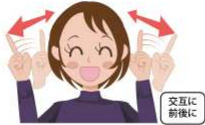
遊ぶ/遊び 楽しそうな表情で、両手の人差し指を立てて、顔の横あたりで交互に前後動かします。