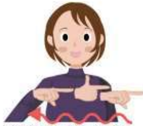
いろいろ／さまざま／～など 左手の人差し指と親指を伸ばし、半回転させながら右から左に移動させます。