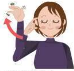
思い出す／懐かしい 右手人差し指でこめかみに触れ、手の平を開いて指を揺らしながら右へ動かします。